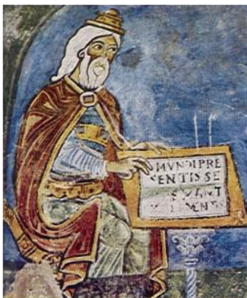
Ippocrate in un affresco del XIII sec. Anagni Cripta del Duomo

Se fossimo in grado di fornire a ciascuno la giusta dose di nutrimento ed esercizio fisico, né in eccesso né in difetto, avremmo trovato la strada per la Salute.