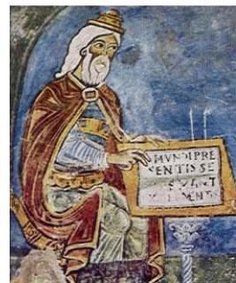
Ippocrate in un affresco del XIII sec. Anagni Cripta del Duomo

Da restituire entro il 31 marzo 2016 per posta o mail a: ASL Monza Brianza - Dipartimento di Prevenzione Medica Servizio Prevenzione Sicurezza Ambienti Lavoro via Novara, 3 – 20832 Desio (MB) e-mail: psaldirezione@aslmb.it pec: dip.prev_medica@pec.aslmb.it